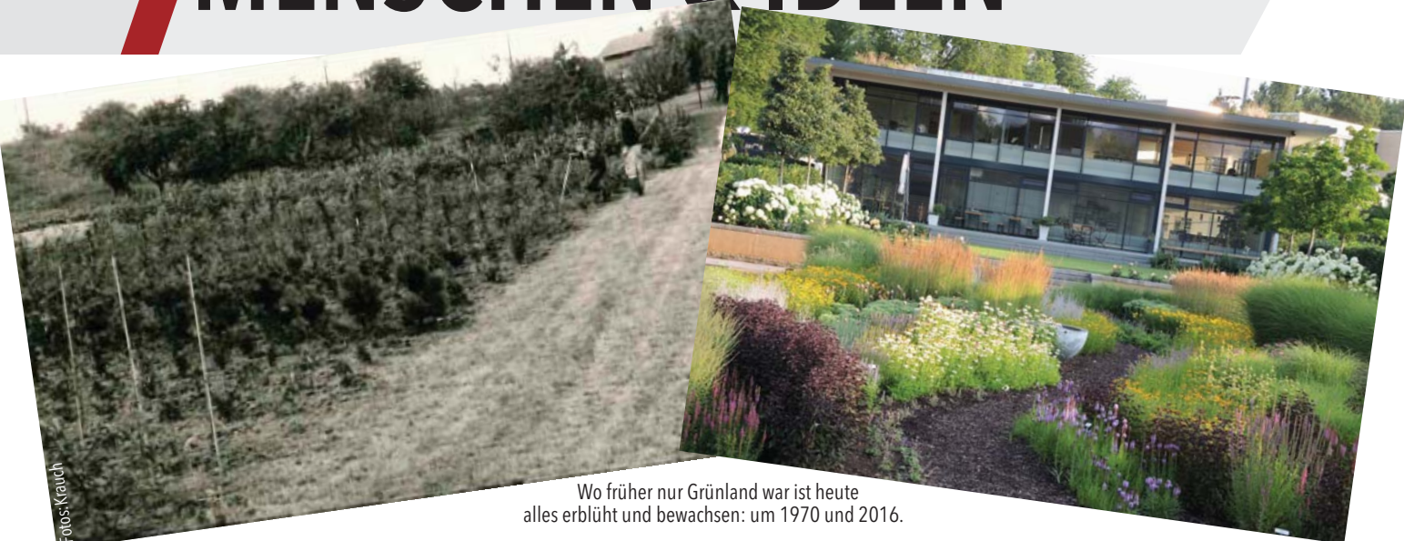
Wo früher nur Grünland war ist heute alles erblüht und bewachsen: um 1970 und 2016.